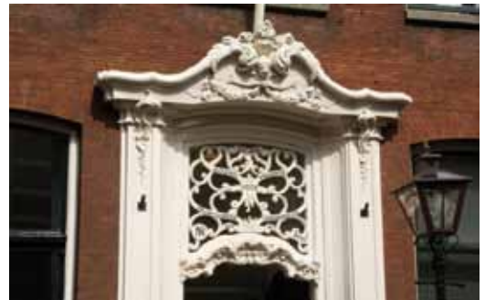
Breestraat 24, aangebracht in 1992.

Rond 1880 doet de portiek zijn intree in de gevel. Dit gaat samen met de terugkeer van het glas-in-lood in het bovenlicht en met tegelta-bleaus langs de zijkanten van de portiek (Jugendstil).