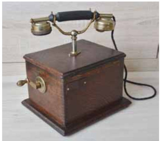
Telefoon, begin 20ste eeuw.

Voor het verbreken van de verbinding, legde beide abonnees hun hoorn op de haak. De lijnen werden weer aan de generator in de toestellen verbonden. Een draai aan de slinger (afbellen) was de melding aan telefoniste om de klinken uit de stoppen te trekken. Let wel, dit principe werkt nú in 2017 nog zo, echter zónder telefonist(e) en volautomatisch. In 1962 (!) zijn alle telefooncentrales in Nederland volledig - elektromagnetisch - geautomatiseerd. Nederland was het eerste land in Europa met een volledig landelijk geautomatiseerd telefoonnet.