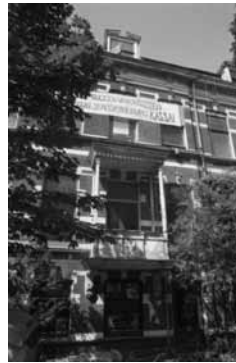
Witte Singel 7, gekraakt in 1990.

Hierna ontstond een levendige, soms zelfs hilarische discussie. Onder de aanwezigen waren