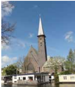
De Sint Josephkerk aan de Herensingel, een ontwerp van Leo en Jan van der Laan.

een kapel, nieuwe vleugels en paviljoens. Tot de verhuizing in 1972 naar Leiderdorp, waarna studenten, een reclamebureau en een biërcafé er bezit van nemen. Op zorggebied zijn er ook nog het gebouw van de katholieke wijkverpleging aan de Middelstegracht uit 1906 en het internaat Sint Lidwinahuis aan de Zoeterwoudsesingel, daterend uit 1933. Vorig jaar werd dit gemeentelijke monument verkocht om het te verbouwen tot luxe appartementen. Het boekje bevat foto's, historische