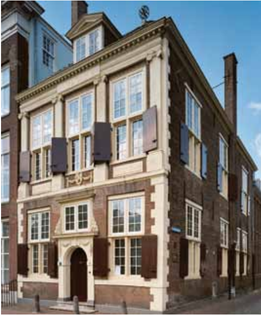
De Bibliotheca Thysiana op de hoek van het Rapenburg en de Groen hazen gracht (foto: Rijksdienst voor het Cultureel Erfgoed).

mee om naar Amsterdam te reizen of dagen in een Haags hotel te overnachten voor een grote verkoping. Soms vroeg hij vrienden en bekenden voor hem boeken te kopen en die naar hem op te sturen.