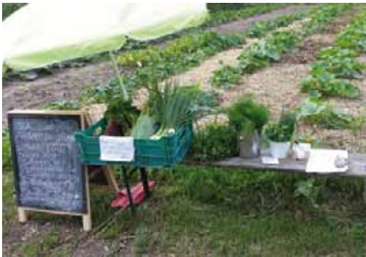
Gedurende 30 weken per jaar wordt er geoogst.

De donateurs die oogsteelnemer zijn, genieten