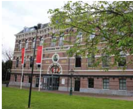
De Kweekschool voor Zeevaart, waarin tegenwoordig advocatenkantoor Geelkerken Linskens gehuisvest is.