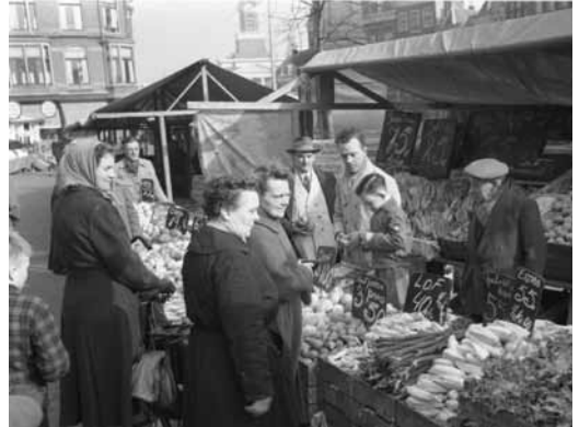
De groente-en-fruitkraam van de familie Van Loef op de Vismarkt in 1956.

Heleen: 'Hoewel alle verhalen over Leiden gaan, zijn ze allemaal verschillend. In het ene gesprek lag het accent vooral op de Leidse binnenstad: hoe zag die eruit? Welke winkels waren er?'