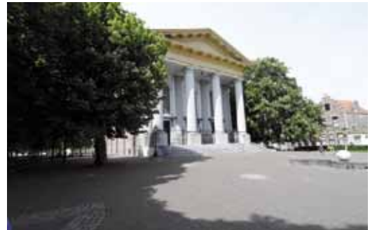
De Nieuwe Kerk.

In de Tachtigjarige Oorlog namen de Geuzen de stad op 8 augustus 1572 in, maar in 1575 moest de stad zich weer overgeven aan de Spanjaarden. Niet voor lang, want door de muiterij van de Spaanse soldaten werd de stad na enkele maanden alweer vrijgegeven.