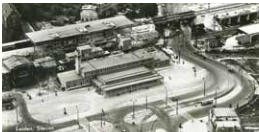
Het oude station van Schelling.

Aan de ziekenhuiskant van het station is Terweepark 3 waar ik later, begin 1960, heb gewoond, al afgebroken om ruimte te krijgen voor het grotere station. Men kent die ellende waar voor de goedkoopste de overkapping in de verkeerde richting ligt, de beloofde roltrappen aan de Warmondse kant er nooit zijn gekomen en er nu, tegen de beloften aan de gemeente in, toch poortjes voor de traverse staan. En wat een mooi station was het! Van het station dat er eerder was, herinner ik me weinig. Mijn twee jaar oudere broer en ik kwamen in de hongerwinter van 1944 eens terug uit de Morsch en bij de spoorwegovergang aan de Haagweg zeiden we 'Er is toch spoorstaking, over het spoor is korter naar Oegstgeest' en we namen de weg over de rails. Weinig wisten we dat de Duitsers de V-2's over dat spoor aanvoerden (en dan per vrachtauto naar de lanceerplaats in Wassenaar), zodat we opkeken toen we bij genoemde overweg met hoge brug omkijkend een bord zagen waarop