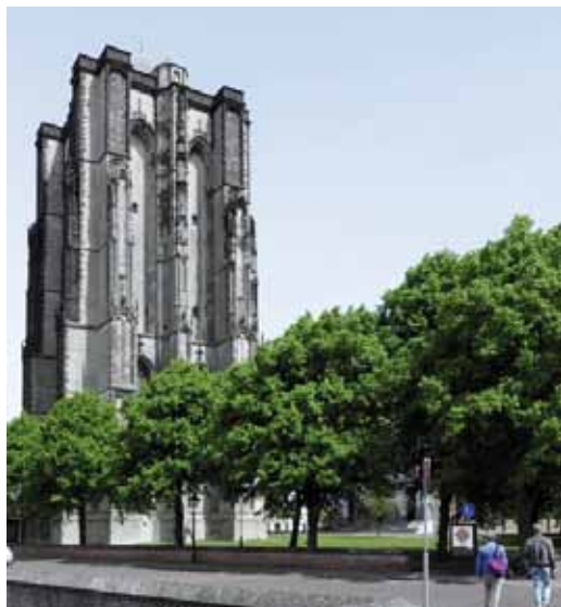
De Sint Lievensmonstertoren.

De stad was goed verdedigbaar, mede door de twee haventorens, de Noorder- en de Zuiderhavenpoort en door de Nobelpoort die het noorden van de stad afslot. Er waren hoge stadsmuren en grachten. Boven alles troonde de toren van grootste kerk van Zeeland, de Sint Lievensmonsterkerk.