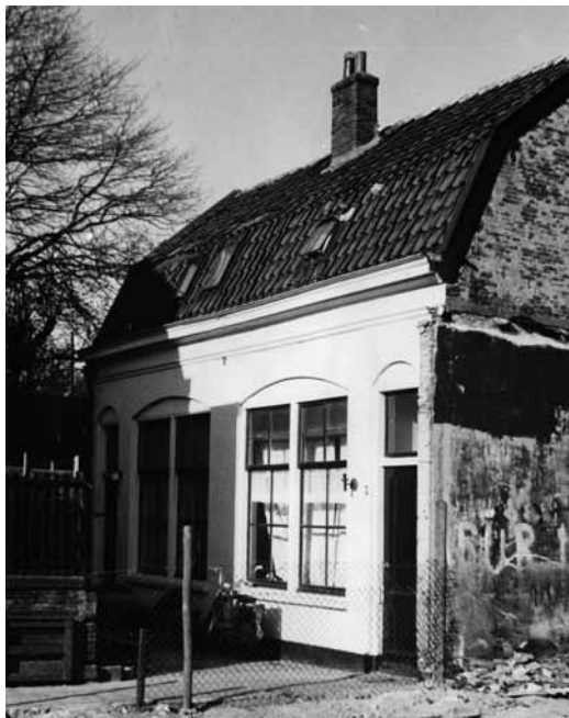
De Komkommerhof aan de 5e Binnenvestgracht in 1973 (foto: J.W.C. Postel).

'Ik heb Leiden beter leren kennen. Graag rijd ik door de Janvossensteeg, waar ik van veel panden de geschiedenis heb gehoord. En ik weet nu waar de Komkommerhof is!', voegt ze toe.