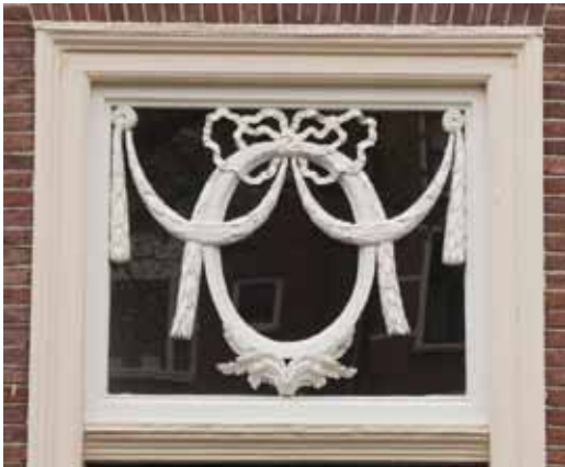
Rapenburg 94, een snijraam in Lodewijk XVI-stijl (foto: Ben Veldstra).

De ouderdom van een bovenlicht correspondeert maar in zeldzame gevallen met de ouderdom van het pand. De houten snijramen zijn aan vermolming onderhevig en wanneer het tijd werd om het bovenlicht te vervangen, werd gekozen voor een nieuw bovenlicht in de dan gangbare stijl. Het snijraam is dus óf even oud óf jonger dan de gevel.