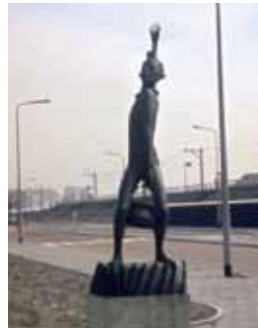
Beeld van de Leidse weesjongen Cornelis Joppensz met een ketel hutspot bij het station Lammenschans.

uit de luxe hochepot -traditie; die beheerste de Nederlandstalige kookboeken tot in de