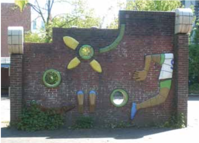
Frans van der Veld, muur met keramisch reliëf, noordzijde, voormalige St. Janschool, Bizetpad.

Noordwijk, Spijkenisse, Nieuwe Tonge, Gorcum en Katwijk. Als beeldhouwer was hij autodidact. In 1962 exposeerde hij samen met een aantal leerlingen in Stedelijk Museum De Lakenhal.