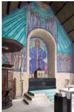
Koor van de Oud-Katholieke kerk aan de Zoeterwoudsesingel.

In deze tijd staan veel kerken op omvallen, de secularisatie is een gegeven feit. Wat te doen met