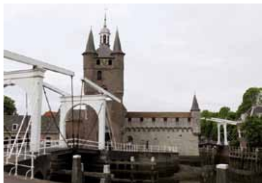
De Noorderhavenpoort.

In de 11de eeuw liep de hoofdstroom van de Schelde langs de Zeeuwse eilanden Schouwen en Duiveland. In 1012 ontstond er na een zware storm een brede en diepe kreek tussen deze eilanden, de Gouwe. Vanuit de Gouwe liep er een smallere kreek Schouwen binnen: de Ee, een Oudnederlands woord dat ‘water’ betekent. Aan dit water ontstond Zieriksee, wat later werd aangepast tot Zierikzee. Zierik is een oude jongensnaam en Zierikzee betekent dus oorspronkelijk ‘(plaats aan het) water van Zierik’.