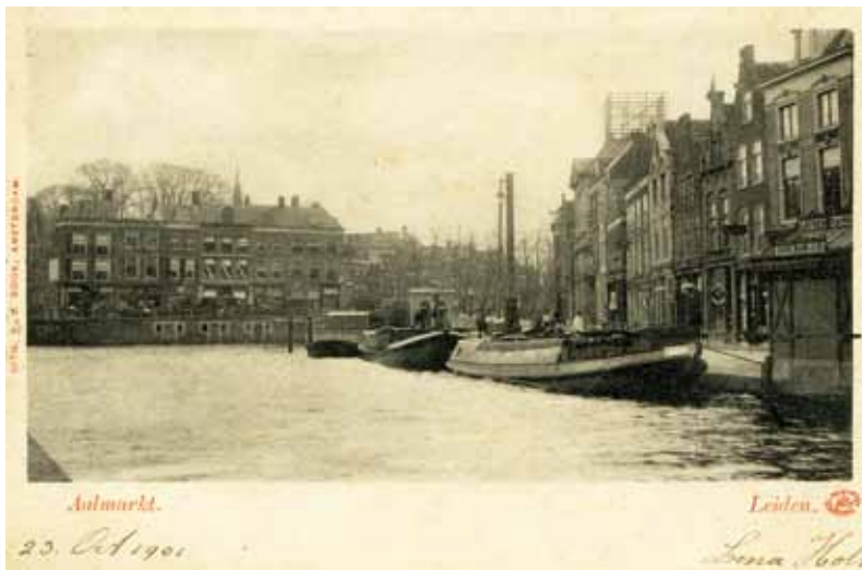
De Waag in 1901.