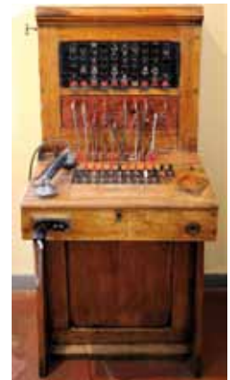
Oude telefooncentrale.