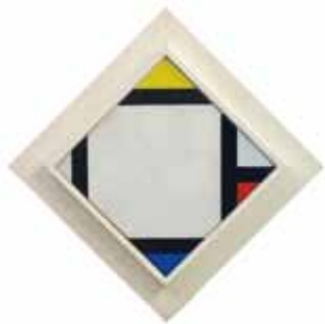
Theo van Doesburg, Contra-compositie VII (1924), recent aangekocht door De Lakenhal.