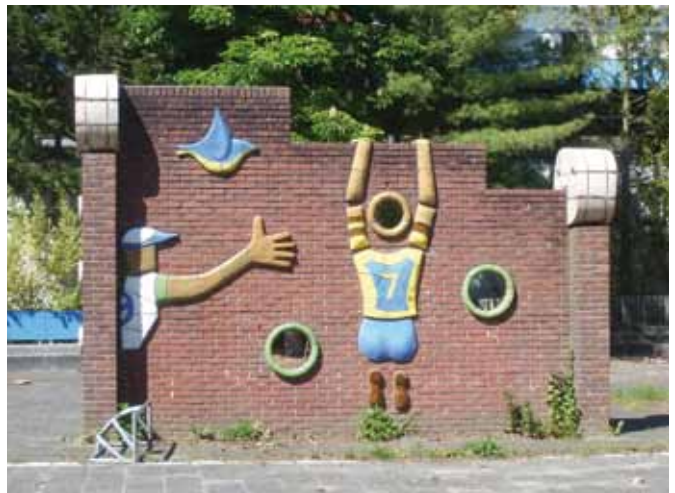
Frans van der Veld, muur met keramisch reliëf, zuidzijde, voormalige St. Janschool, Bizetpad (foto: Jos Hooghuis).

kunstwerk dat kenmerkend is voor de wederopbouwperiode en dat zeer vernieuwend was in de eigen tijd, helaas verloren gaan.