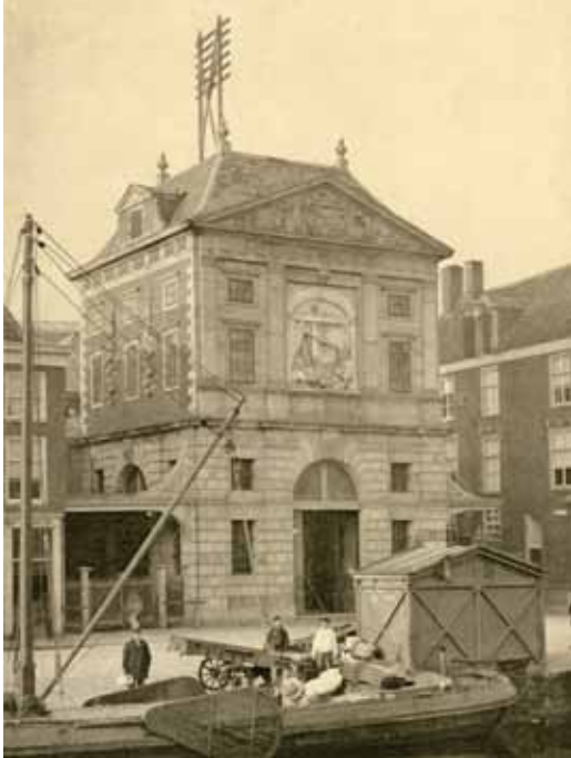
De Waag in 1895.

Bij het beschrijven van de foto's in de HVOL-Beeldbank kwamen we het bijgaande plaatje tegen. De Waag in 1895 met een opvallende constructie op het dak. Wat was de functie van dit rek op het dak? Een mooi uitzoekklusje, dat onlangs ter sprake kwam bij het overleg van de beschrijvers van de Beeldbank.