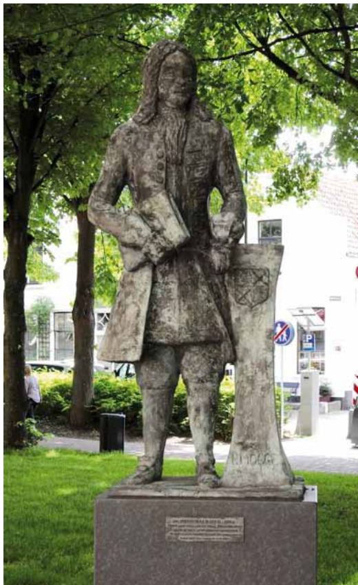
Standbeeld van mr. Pieter Mogge.

wilde financieren. Dat plan werd uiteindelijk geboycot met name door de Leidse universiteit.