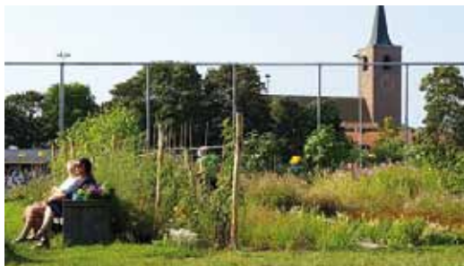
Stadstuinderij Het Zoete Land aan de Zoeterwoudsesingel (foto: Jessica Zwartjes).

Hiernaast realiseren we sociaal-educatieve projecten zoals activiteiten voor bewoners van het naastgelegen verzorgingstehuis de Lorentzhof, voedsellessen aan schoolklassen en het opleiden van stagiairs afkomstig van de landbouwschool.