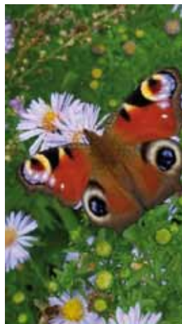
Er is ook ruimte voor bloemen op de stadstuinderij.

een keerzijde gezien de milieubelasting als gevolg van transport en de verplaatsing van mineralen: waar elders verarming van bodems optreedt, is in Nederland een mestoverschot ontstaan.