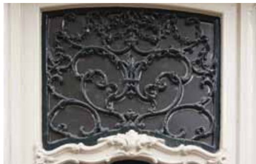
Hooigracht 27.

Aangezien een bovenlicht boven de voordeur een centrale plaats in de gevel heeft, konden de